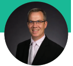
Por Dan Preston